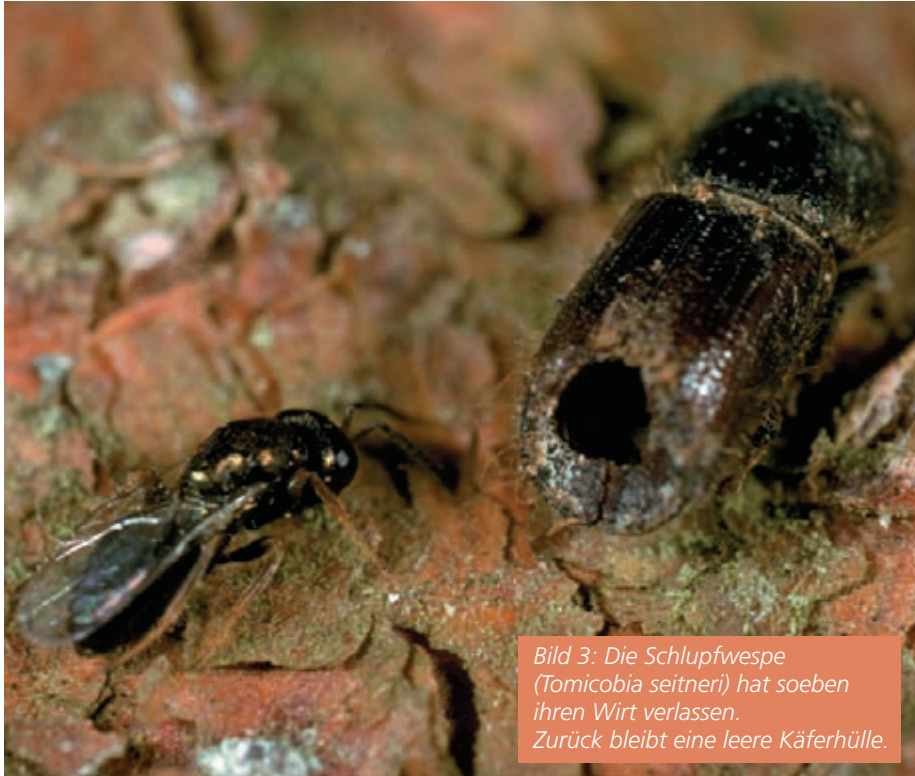
Bild 3: Die Schlupfwespe (Tomicobia seitneri) hat soeben ihren Wirt verlassen. Zurück bleibt eine leere Käferhülle.