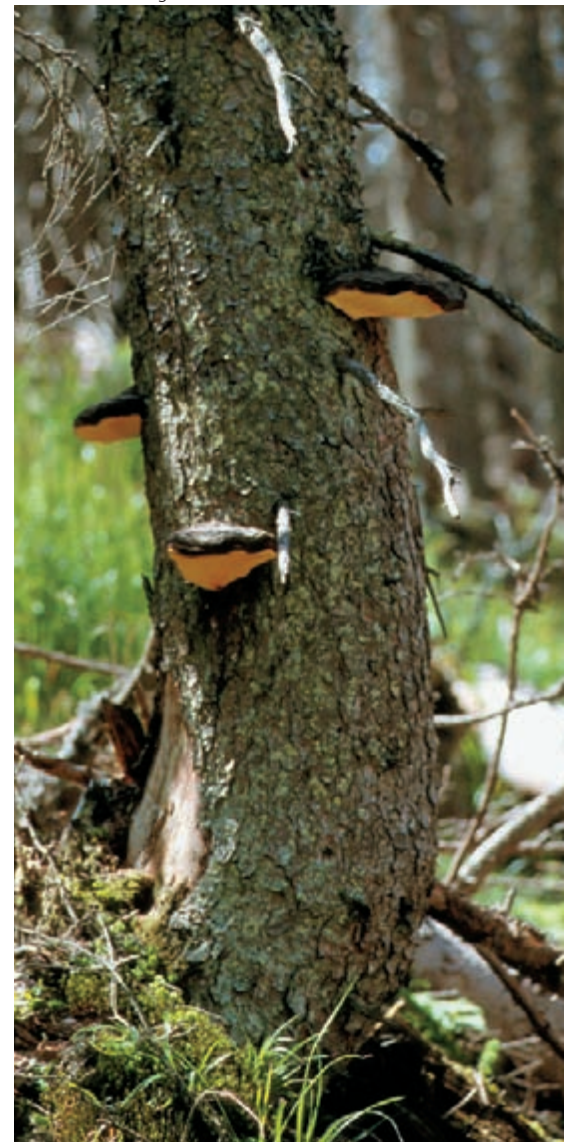
Bild 5: Der Rotrandige Baumschwamm (Fomitopsis pinicola) baut vor allem Zellulose ab. Er verursacht eine Braunfäule und bevorzugt eher feuchtere und kühlere Bedingungen.