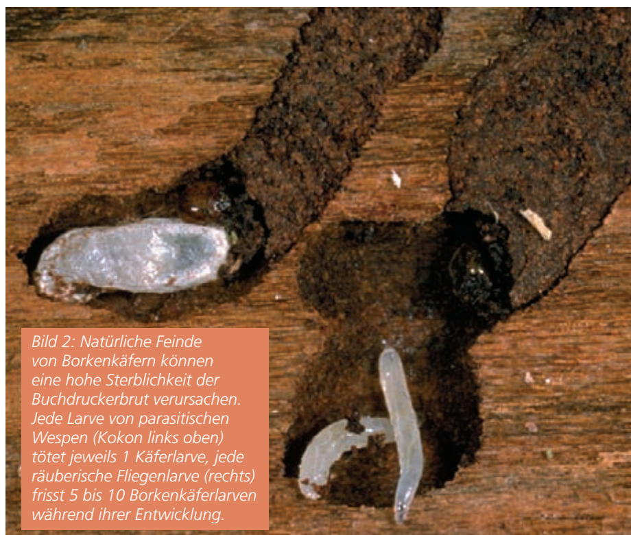
Bild 2: Natürliche Feinde von Borkenkäfern können eine hohe Sterblichkeit der Buchdruckerbrut verursachen. Jede Larve von parasitischen Wespen (Kokon links oben) tötet jeweils 1 Käferlarve, jede räuberische Fliegenlarve (rechts) frisst 5 bis 10 Borkenkäferlarven während ihrer Entwicklung.

Das Entfernen von Einzelbäumen oder Baumgruppen schwächt den Bestand als Ganzes. Löcher im Bestand bieten dem Wind bessere Angriffsmöglichkeiten, es entstehen darin starke Turbulenzen. Verschiedene Untersuchungen zeigen, dass Bestände nach einer Durchforstung anfälliger auf Sturm sind [1]. Dies wurde kürzlich auch in der Schweiz bestätigt: Bestände mit einer kurz vor Lothar durchgeführten Durchforstung oder mit früheren Vivian-Schäden waren häufiger von Schäden betroffen als andere [2]. Das Fällen von Käferbäumen, bzw. das Zwangsnutzen von ganzen Käfernestern lässt kleine und grössere Lücken im Bestand entstehen, die mindestens die gleiche Wirkung haben wie eine Durchforstung. Solche Lücken setzen auch die angrenzenden Bäume einem neuen, veränderten Mikroklima aus (Sonneneinstrahlung, Trockenheit). Dies lässt sie wiederum anfälliger werden auf weitere Stressfaktoren wie z. B. Borkenkäfer. Das Stehenlassen von Käferbäumen stellt einen weniger abrupten Übergang von einem geschlossenen in einen lückigen Bestand dar.