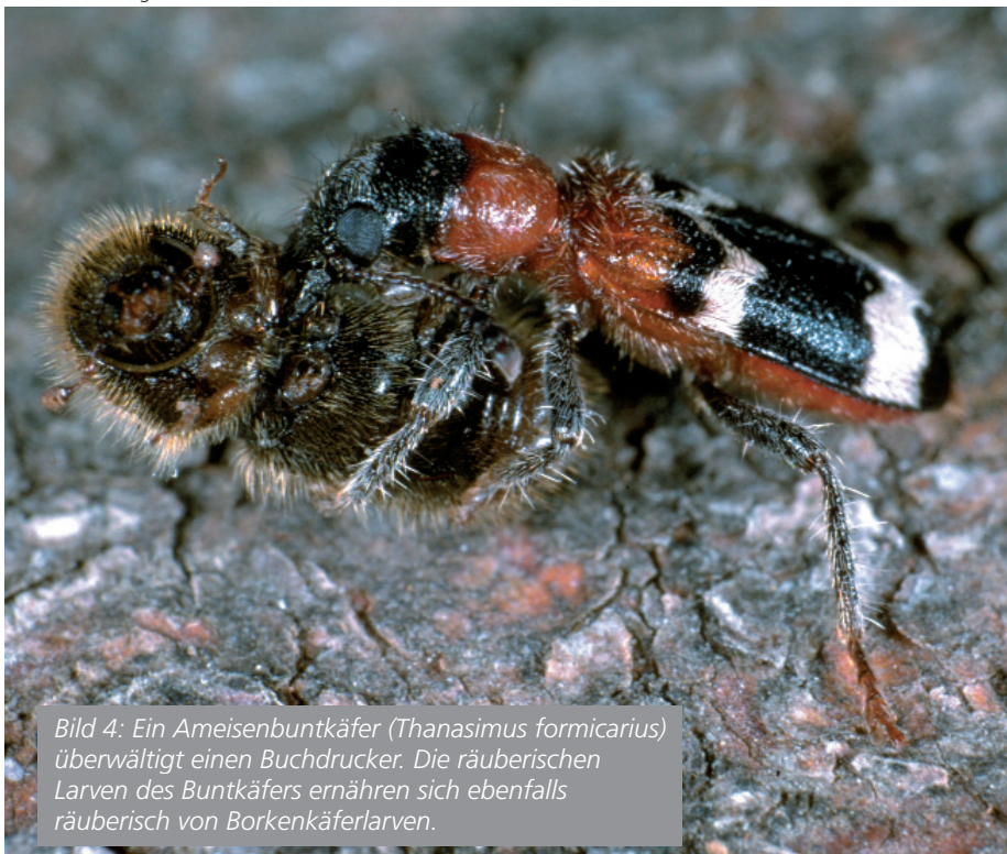
Bild 4: Ein Ameisenbuntkäfer (Thanasimus formicarius) überwältigt einen Buchdrucker. Die räuberischen Larven des Buntkäfers ernähren sich ebenfalls räuberisch von Borkenkäferlarven.