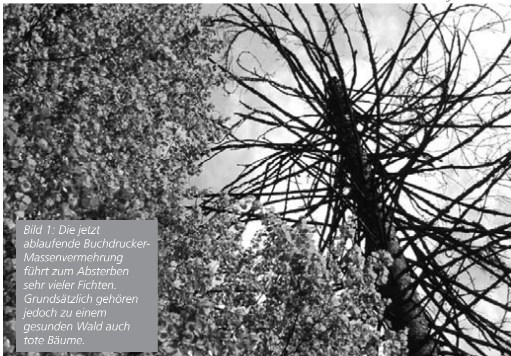
Bild 1: Die jetzt ablaufende Buchdrucker-Massenvermehrung führt zum Absterben sehr vieler Fichten. Grundsätzlich gehören jedoch zu einem gesunden Wald auch tote Bäume.